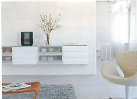
Zeitlos-moderne Einrichtung in solider Qualität – das Sortiment von „schauburg – möbel. design. lebensart“.

Feng Shui oder klassische Inneneinrichtung. Mit neuester Planungssoftware kann er Räume, die ausgestattet werden sollen, dreidimensional darstellen, um so den bestmöglichen Eindruck zu liefern. 20 erfolgreiche Jahre – und wieder zeigt sich, dass Qualität und Service der Schlüssel zum Erfolg sind. www.roterpunkt.de