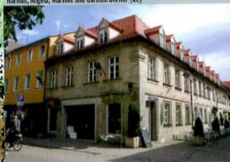
rschauburg in Erlangen